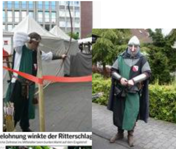
Als Belohnung winkte der Ritterschlag